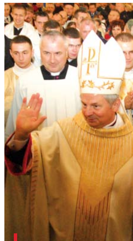
Wychodząc z katedry, nowy ordynariusz radomski pozdrawiał i błogosławił wiernych