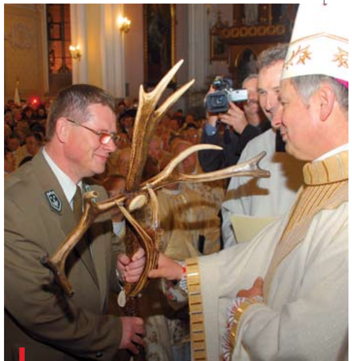
Leśnicy przynieśli krzyż