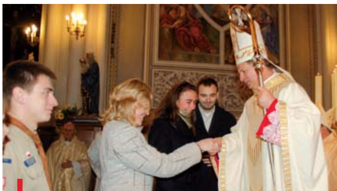
Homagium składa delegacja młodzieży