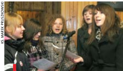
Przeżycia związane z „Kuznią” młodzież ubogaciła śpiewem