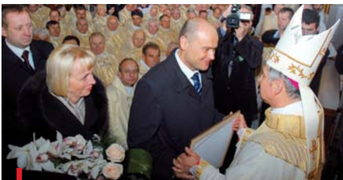
Swoj dar dla pasterza złożył prezydent Radomia Andrzej Kosztowniak