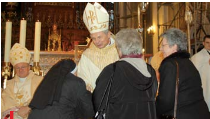
Homagium, znak czci dla nowego pasterza, składają siostry zakonne