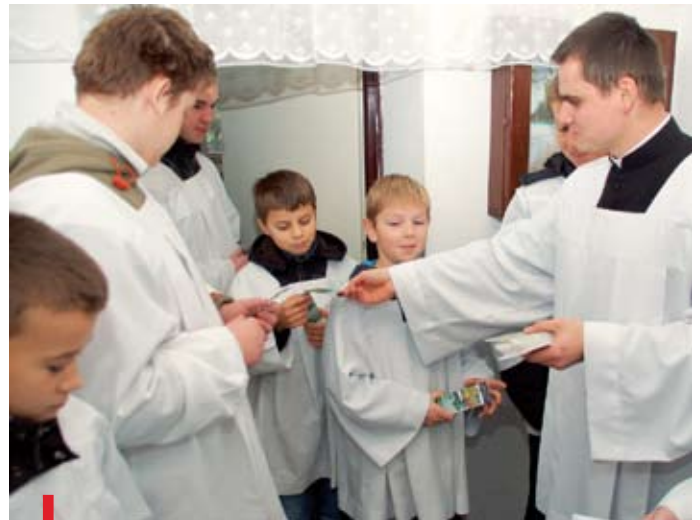
Alumni seminarium najczęściej wywodzą się spośród ministrantów. Służba liturgiczna w Sławnie otrzymała od alumnów pamiątkowe zakładki